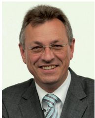
Siegfried Schneider Staatsminister, Leiter der Bayerischen Staatskanzlei und Vorstandsvorsitzender des MedienCampus Bayern e.V.

Der MedienCampus Bayern e.V. ist Dachverband für Medienaus- und -weiterbildung und wurde 1998 auf Initiative des Freistaats Bayern gegründet. Er zeigt Wege in die Medien auf und bietet u. a. Schülern, Studenten und Berufseinsteigern Orientierung beim Einstieg in die Branche.