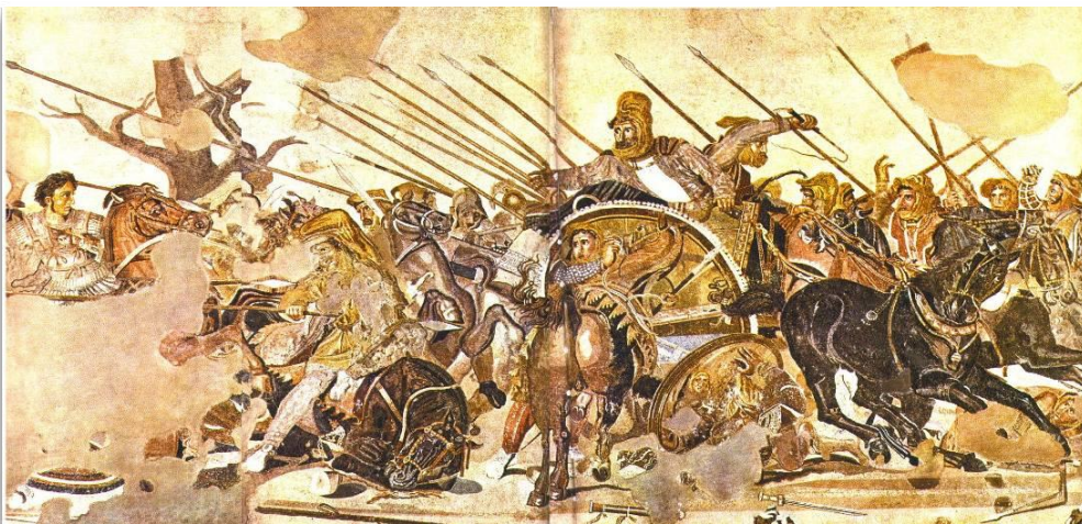
Alexander the Great Confronts Darius III at the Battle of Issos 333. Roman mosaic copy after a Greek painting of 310 BC.

In 333 BC Alexander won the battle of Issos against Darius II.