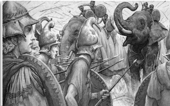
War elephants at the battle of Hydapes